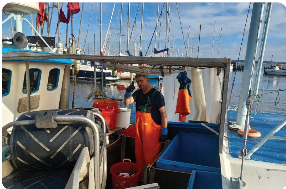
Industrifisker på Roskilde fjord

"Som formand for Roskilde Havneforum har jeg mærket den voksende vilje og åbenhed, der har udviklet sig mellem de fleste af aktørerne på havnen. Det glæder mig meget - vi vil gerne hinanden!"