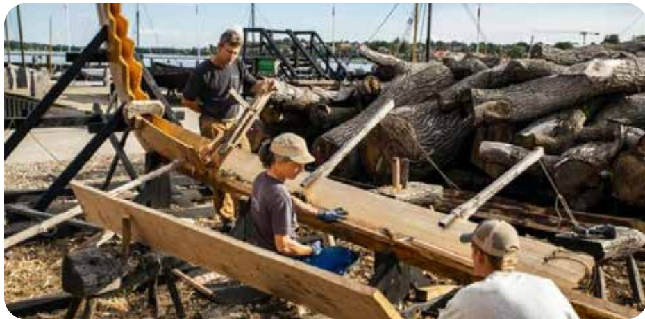
Bådebyggerne fortsætter denne sommer med at arbejde sig opad og skabe skibets sider og indre dele.

Den nye båd bliver 9,7 meter lang, klinkbygget i eg og fyr, med fem par årer og et firkantet råsejl. Skroget formes med udgangspunkt i det arkæologiske fundmateriale fra Gokstad og bygger på erfaringer fra tidligere rekonstruktioner – herunder båden Eik Sande, bygget på værftet i 2013.